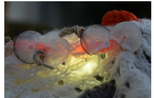
Kunstwerk op de cover van de paasgroetenkaart 2022

Ieder jaar worden via de Paasgroetenactie vanuit het hele land tienduizenden paaskaarten naar gevangenissen gestuurd. Ook in de Veertigdagentijd 2022 organiseren de Protestantse Kerk en Kerk in Actie deze actie om gedetineerden een kaartje te sturen met Pasen. Het thema van dit jaar is 'Uw licht heelt wat gebroken is'. Het ontvangen van een paasgroet doet goed. Gevangenen realiseren zich dat er mensen zijn die zich inleven in hun situatie. "De vrouw die dit geschreven heeft, kent mij helemaal niet en toch krijg ik deze kaart," was de verbaasde reactie van een vrouwelijke gedetineerde toen ze een paasgroet ontving.